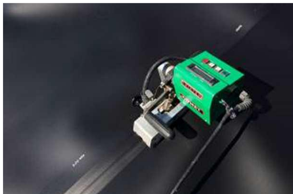
Figure 2 – Réalisation de soudures sur géomembranes bitumineuses à l'aide de matériel électrique