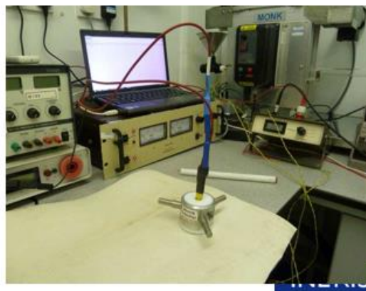
Figure 4 : Vues des montages de réalisation de la mesure de la résistance de surface et transversale de géomembranes