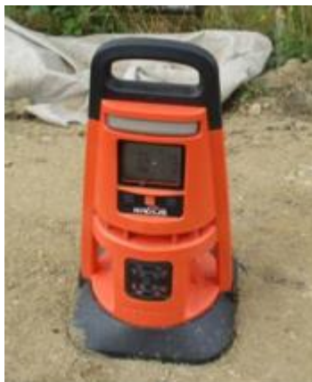
Figure 3 : Balise de détection d'atmosphère explosible