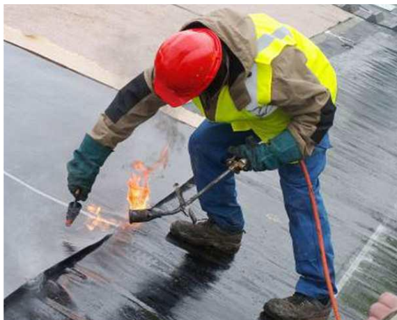
Figure 1 – Réalisation de soudures sur géomembranes bitumineuses par des opérateurs