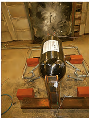
Figure 1 / Montage expérimental, confinement et position des thermocouples.

Ces tests ont permis de définir une stratégie de dépressurisation, qui permet de maintenir la bouteille à une pression interne ne conduisant pas à l'éclatement. Pour les tests avec une pression