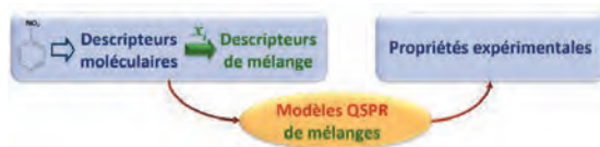
Fig1 Schéma de principe des modèles QSPR pour des mélanges