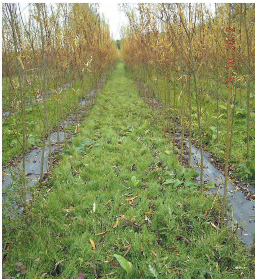
Fig1 Canche cespiteuse en couverture au sol en interrangées avec les saules