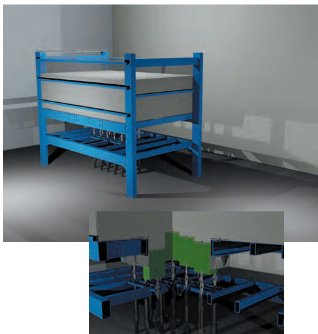
Fig1 Simulateur de mouvements de terrain et zoom sur la partie pilotage des mouvements