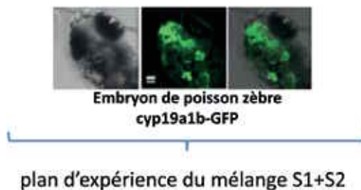
plan d'expérience du mélange S1+S2