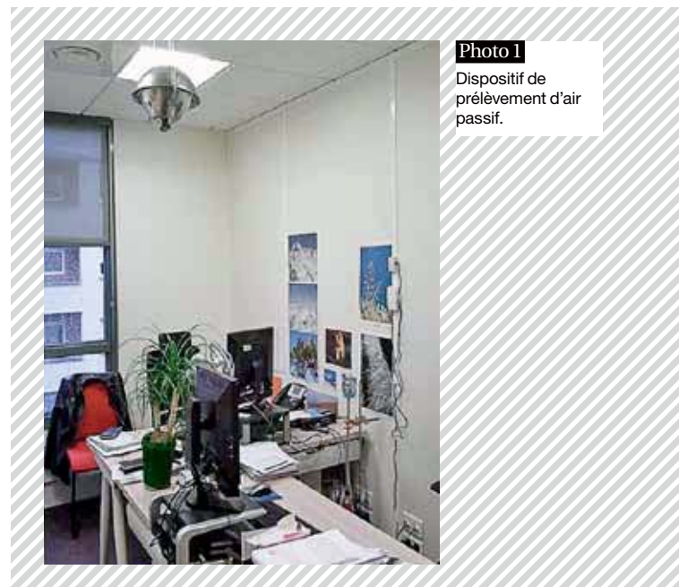
Photo 1 Dispositif de prélèvement d'air passif.