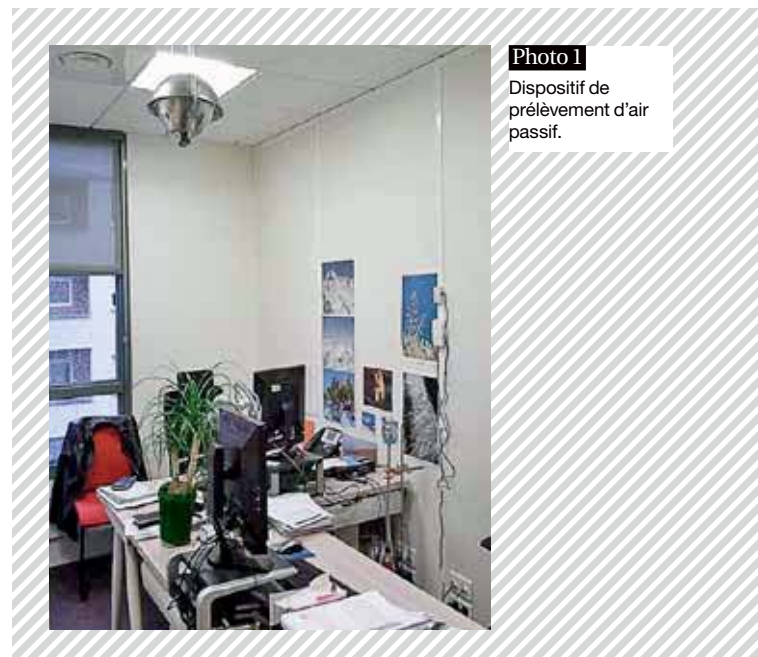
Photo 1 Dispositif de prélèvement d'air passif.