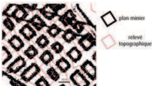
FIGURE 1 EXEMPLE D'INCERTITUDE SUR LA DONNÉE : COMPARAISON ENTRE PLAN MINIER GÉORÉFÉRENCÉ ET RELEVÉ TOPOGRAPHIQUE RÉEL (DONNÉES GEODERIS)

• L'identification et la compréhension des phénomènes étudiés : problèmes liés à l'interprétation et l'analyse des événements passés, aux connaissances propres de l'expert, à sa capacité à se représenter le problème étudié.