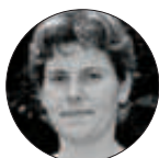
G. Fayet/P. Rotureau

L'évaluation de l'explosibilité des substances chimiques condensées (risque d'explosion) lors de diverses opérations, comme la fabrication, le stockage, le transport ou la mise en œuvre, repose essentiellement sur le retour d'expérience et la conduite d'essais réalisés selon des référentiels réglementaires internationaux [1]. L'évolution récente de la réglementation européenne en matière de contrôle des produits chimiques (règlements REACH et CLP [2]) induit un volume de travaux incompatible avec une détermination expérimentale systématique de leurs propriétés dangereuses (faisabilité matérielle, coût financier et délais raisonnables) puisque plus de 140 000 substances chimiques sont concernées par REACH. Aussi, le recours à des méthodes prédictives (alternatives ou complémentaires à l'expérimentation) comme les approches QSPR (relations quantitatives structures-propriétés) sont largement encouragées par REACH.