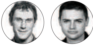
D. Charpentier/F. Brissaud