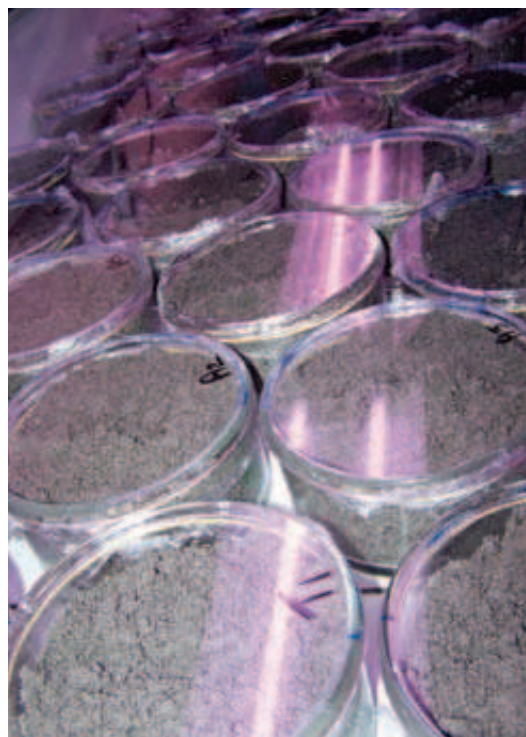
Tests sur vers de terre

aquatiques sur percolats ou lixiviats de sol) sont principalement dépendants du poids donné aux paramètres durée d'exposition/temps nécessaire à la réalisation des essais. De plus, cette étude indique que la méthode de sélection a priori ne permet pas de juger, à l'heure actuelle, de la complémentarité des tests au sein d'une batterie en terme de niveaux trophiques, critères d'effets étudiés (aigus, chroniques, génotoxiques...) ou type d'approche (directe ou indirecte). Ces premiers travaux apparaissent prometteurs. La démarche proposée est originale et, même si elle apparaît perfectible, elle montre tout son intérêt. Elle permet d'identifier les tests pertinents au regard du scénario considéré et donc susceptibles d'être incorporés dans des batteries d'essais. Toutefois, dans le cadre de l'élaboration d'une batterie optimale, des paramètres complémentaires vont devoir être pris en compte tels que l'adéquation entre le nombre d'essais à mettre en œuvre et l'exhaustivité de la réponse obtenue.