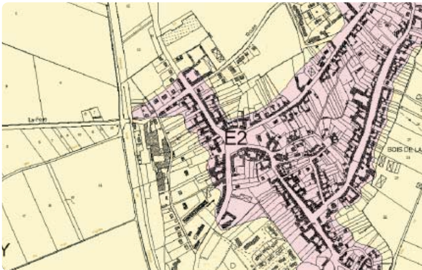
Exemple de cartographie des aléas en zone péri-urbaine.