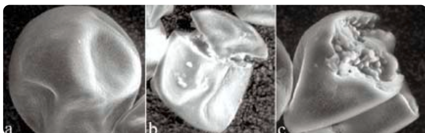
Grains de pollens intacts (a) ou endommagés à la suite de l'exposition à 50 ppm de \text{NO}_2 (b) ou 0,7 ppm d' \text{O}_3 (c). Microscopie électronique, X7500 (a), X3000 (b), X6000 (c).