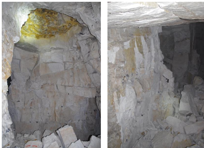
Figure 2 : Dégradations observées dans la carrière souterraine

L'exploitation souterraine de la craie est généralement mise en place par la méthode des chambres et piliers, qui consiste à enlever du gisement tout en laissant en place des piliers assurant le maintien des terrains situés au-dessus de l'ouvrage. En fin d'exploitation, celle-ci est en général abandonnée, sans travaux de remblaiement, la stabilité des terrains au-dessus de la zone d'extraction est alors fragilisée et présente dès lors des risques d'effondrement (Figure 2).