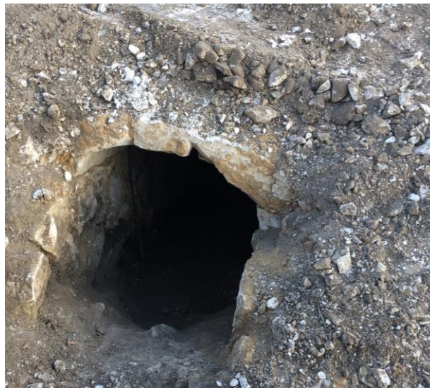
Figure 4 : Aperçu de la galerie d'accès et de la nature des terrains en place