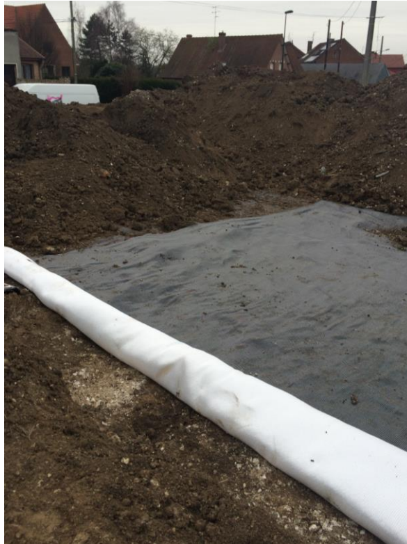
Figure 4. Mise en place du géosynthétique, avancement bande par bande.