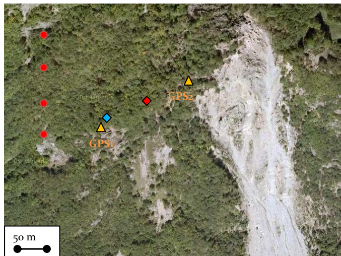
Figure 1. Vue aérienne du versant de Séchilienne (fond de carte ©Google) et positions des équipements : capteurs microsismiques dans la galerie (ronds rouges), balises GPS-RTK (triangles oranges) et forages pour mesures hydrologiques (diamant bleu) et microsismiques (losange rouge).

En 2009, un programme de reconnaissance par forages profonds a été lancé pour améliorer les connaissances sur l'hydrologie du site et les mécanismes de déformations en profondeur. C'est dans ce contexte que l'INERIS a mis en œuvre un dispositif d'observations multi-paramètres en bordure Ouest de la zone des Ruines (Figure 1) avec le soutien du CEREMA et du MEDDE.