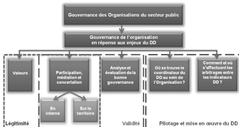
Figure 1. Thèmes abordés par le GT Gouvernance