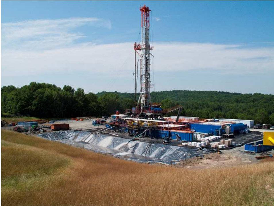
Figure 3 : Exemple de site d'exploitation de GHRM par fracturation hydraulique.

La spécificité de l'extraction des hydrocarbures non conventionnels résulte principalement dans l'existence d'installations de mélange et d'injection, sous haute pression, de fluides comportant divers produits chimiques. La présence d'installation de traitement et de stockage des effluents constitue une autre spécificité. Une adaptation des mesures de prévention des risques à ces spécificités devra donc être engagée, aussi bien pour ce qui concerne les risques et impacts potentiels sur les hommes (travailleurs et riverains), les biens, les activités humaines et l'environnement.