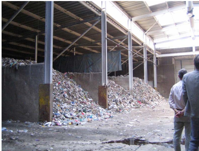
Figure 1 : stabilisation aérobie en hangar fermé, boxes, aération forcée du compost

La méthanisation est la biodégradation des matières organiques en absence d'oxygène, donc en réacteur. Cette dégradation produit des quantités importantes de biogaz, constitué de méthane (jusqu'à 60 % v/v), gaz carbonique (20 à 40 % v/v), de vapeur d'eau et de composés en traces (composés soufrés, composés organiques volatils...)