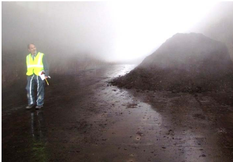
Figure 2 : compostage en boîtes fermées, aération forcée du compost (photo prise peu après l'ouverture du box)