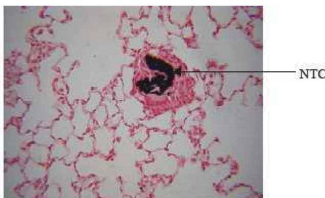
Figure 2 : Formation de granulome au niveau des alvéoles pulmonaires d'un rat traité par 0,5 mg de NTC.

Les premières études portant sur la toxicité des NTC in vivo ont été réalisées par IT. A de fortes doses, 0,1 à 0,5 mg/souris et 0,1 à 5 mg/rat, les auteurs ont montré l'apparition de granulomes au niveau des poumons des rongeurs [Lam et al. , 2004 ; Shvedova et al. , 2005 ; Warheit et al. , 2004] (figure 2). Les granulomes pulmonaires sont des structures anatomopathologiques constituées d'un amas de cellules immunitaires (lymphocytes, neutrophiles, éosinophiles, macrophages) au niveau du parenchyme pulmonaire et généralement dus à une réaction localisée face à la présence d'un élément étranger. Ils sont généralement accompagnés de la sécrétion par les cellules immunitaires de cytokines inflammatoires.