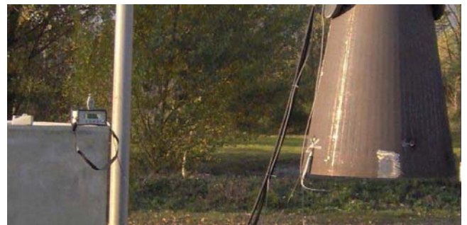
Fig 5. Photo des essais statiques

Les premiers essais ont été réalisés à l'air libre en extérieur en présence d'un vent moyen non négligeable jusqu'à une dizaine de km/h et en ne procédant qu'à l'injection du mélange sans allumage (Fig 3). Un anémomètre (situé sur le boîtier) est utilisé pour mesurer la vitesse du vent. Ce vent, qui a permis de s'approcher des conditions réelles d'utilisation est a priori un facteur défavorable avec une tendance à l'aspiration du mélange contenu à l'intérieur du cône. D'ailleurs, les mesures effectuées montrent des « fuites » d'hydrogène au niveau de l'extrémité basse du cône dès la 3ème seconde de remplissage : Pour autant, il ne s'agit que d'effluves limités à 0,7%. La sonde est fixée sur le bas du cône.