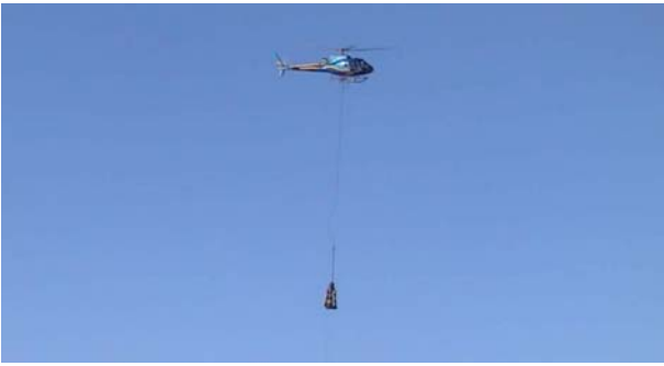
Fig 1. Prototype Daisy Bell en phase de vol