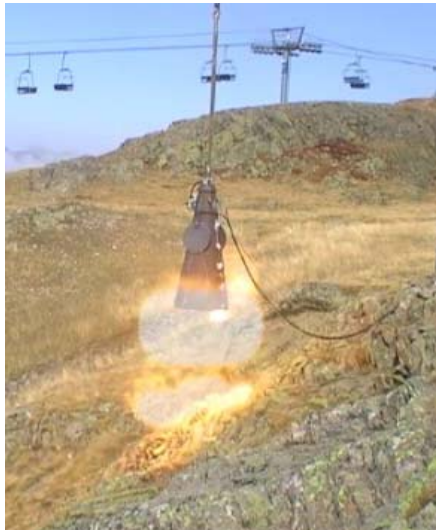
Fig 2. Premier essai de validation du prototype Daisy Bell