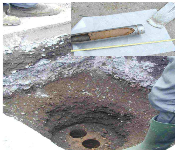
Photo 3 : Echantillonnage de sol sous-jacent par carottage dans une tranchée