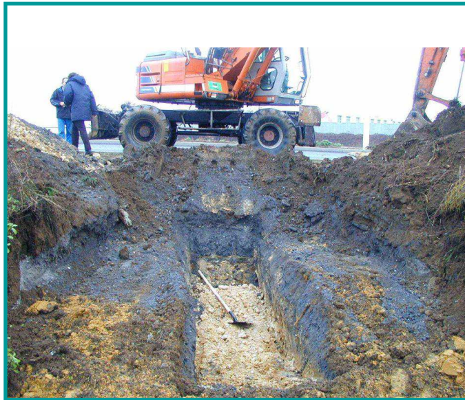
Photo 2 : Réalisation d'une tranchée à l'aide de la pelle mécanique