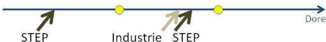
Figure 1 : Représentation schématique de la zone d'étude. Les flèches localisent les rejets des stations d'épuration des eaux usées urbaines (STEP) et de la station d'épuration des eaux industrielles (Industrie). Les deux points sur le cours d'eau indiquent la position des stations d'échantillonnage par rapport aux différents rejets.